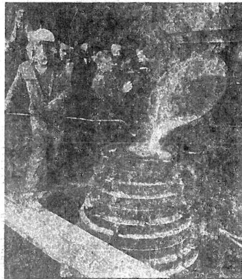
DE GIETPAN wordt leeggegoten in de klok vorm van de Agnes Mayor. De man met de „schuimspaan” haalt de slakken van het gloeiendhete brons.